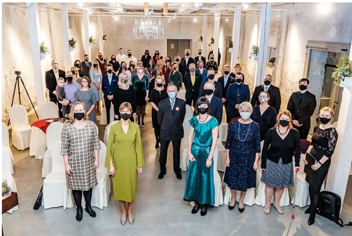
Foto 2020 aasta tunnustusest Anija mõisas.