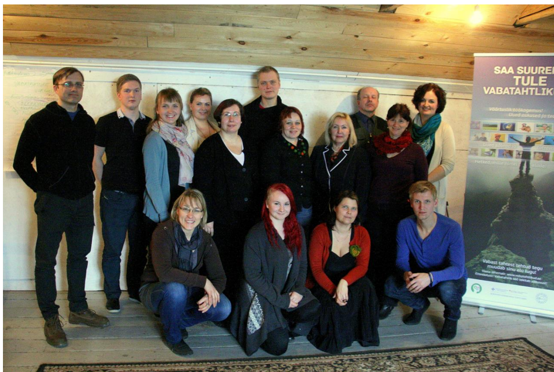
Foto 20.03.2014 Paides, Vabatahtliku tegevuse võrgustiku loojad